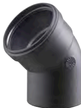
CURVA 45° MASCHIO/FEMMINA 45° BEND, MALE/FEMALE