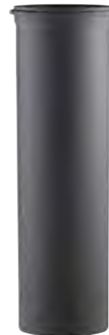
ELEMENTO LINEARE H=500 LINEAR ELEMENT H=500