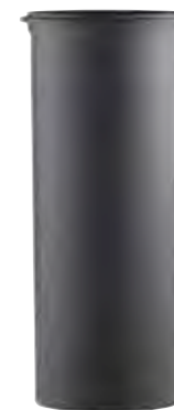
ELEMENTO LINEARE H=250 LINEAR ELEMENT H=250