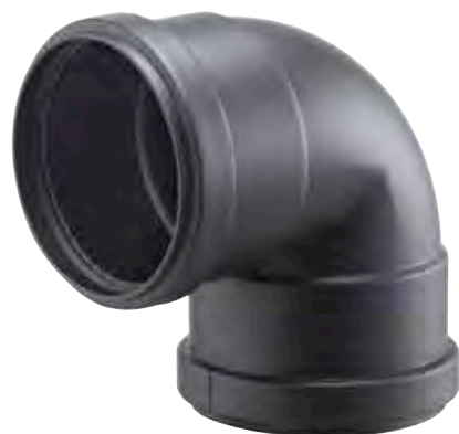
CURVA 90° FEMMINA/FEMMINA 90° BEND, FEMALE/FEMALE