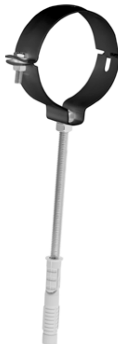
COLLARE CON TASSELLO PIPE CLAMP W/ WALL PLUG