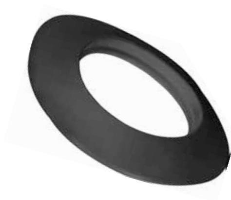
ROSONE IN SILICONE SILICONE ROSETTE