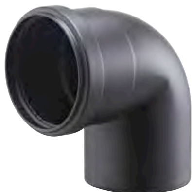
CURVA 90° MASCHIO/FEMMINA 90° BEND, MALE/FEMALE