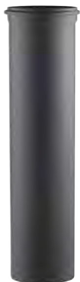
ELEMENTO LINEARE H=1000 LINEAR ELEMENT H=1000