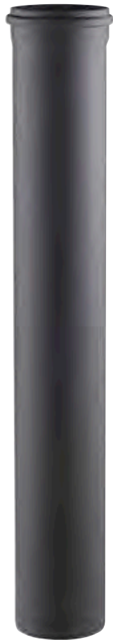
ELEMENTO LINEARE H=2000 LINEAR ELEMENT H=2000