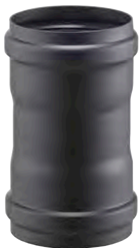
MANICOTTO FEMMINA/FEMMINA FEMALE/FEMALE SLEEVE