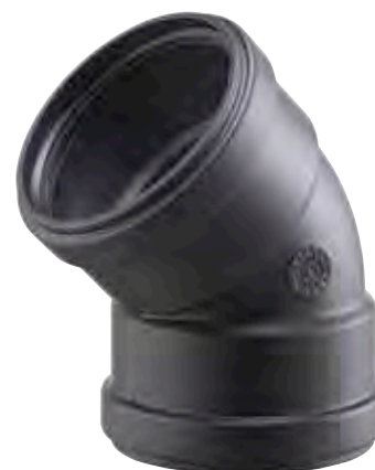
CURVA 45° FEMMINA/FEMMINA 45° BEND, FEMALE/FEMALE