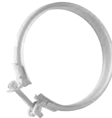
FASCETTA DI GIUNZIONE JOINT BAND