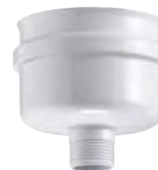
TAPPO DI SCARICO CONDENZA CONDENSATE DRAIN CAP