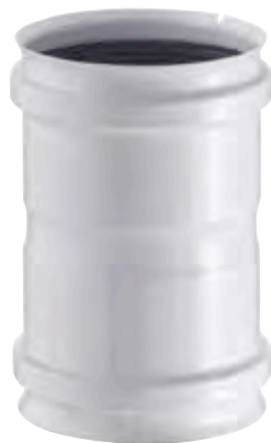
MANICOTTO FEMMINA/FEMMINA FEMALE/FEMALE SLEEVE