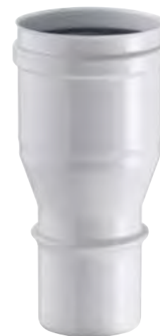
AUMENTO DI SEZIONE INCREASER