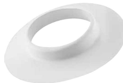
ROSONE EPDM PER INTERNO EPDM ROSETTE, INTERIOR