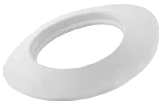
ROSONE EPDM PER ESTERNO EPDM ROSETTE, EXTERIOR