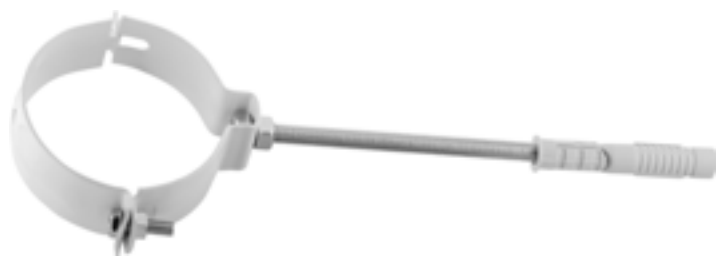
COLLARE CON TASSELLO PIPE CLAMP W/ WALL PLUG