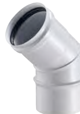
CURVA A 45° 45° BEND