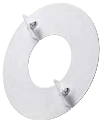
ROSONE DI FINITURA FLAT FINISHING ROSETTE, STEEL

WHITE SINGLE-WALL STAINLESS STEEL A316L WHITE LINE