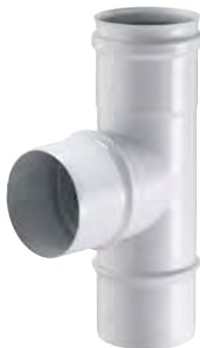
RACCORDO A T 90° 90° TEE PIECE