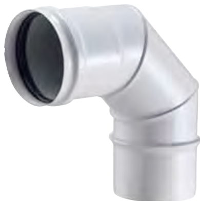
CURVA A 90° 90° BEND