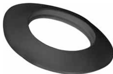
ROSONE IN SILICONE SILICONE ROSETTE