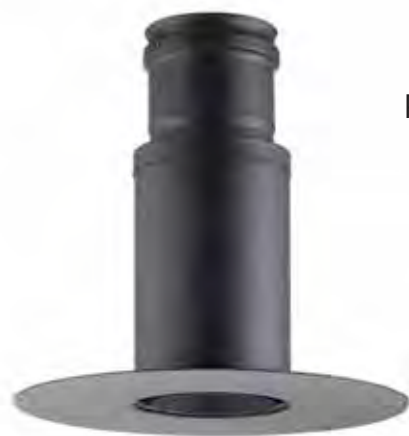
ROSONE UNICO PER SOLAIO/PARETE UNIQUE ROSETTE FOR ROOF/WALL