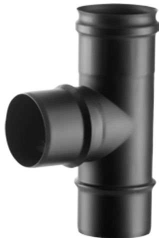
RACCORDO A T 90° STACCO MASCHIO 90° TEE PIECE, MALE BRANCH