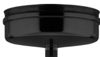
TAPPO CON SCARICO CAP WITH DRAIN