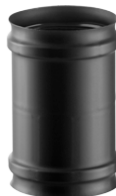
MANICOTTO FEMMINA/FEMMINA FEMALE/FEMALE SLEEVE