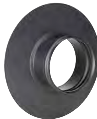
ROSONE A MURO PASSANTE CROSSING ROSETTE FOR WALL