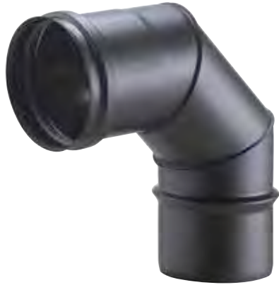
CURVA A 90° 90° BEND