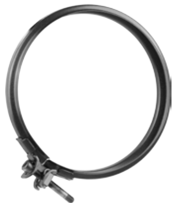
FASCETTA DI GIUNZIONE JOINT BAND