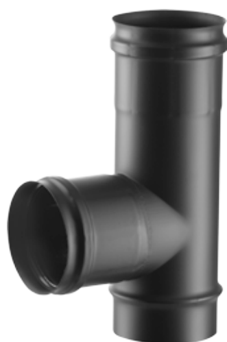
RACCORDO A T 90° STACCO FEMMINA 90° TEE PIECE, FEMALE BRANCH