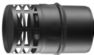
GRIGLIA SCARICO ORIZZONTALE HORIZONTAL EXHAUST GUARD