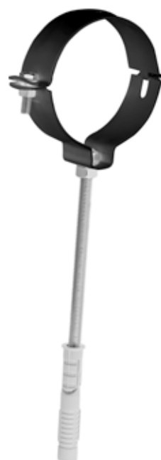
COLLARE CON TASSELLO PIPE CLAMP W/ WALL PLUG