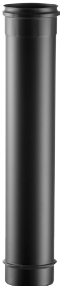
ELEMENTO LINEARE H=2000 LINEAR ELEMENT H=2000