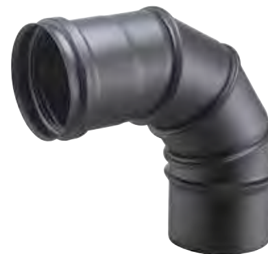
CURVA GIREVOLE REGOLABILE 0-90° 0-90° ADJUSTABLE BEND