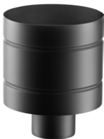
TERMINALE ANTIVENTO WINDPROOF CAP