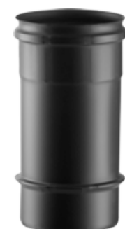
ELEMENTO LINEARE H=250 LINEAR ELEMENT H=250