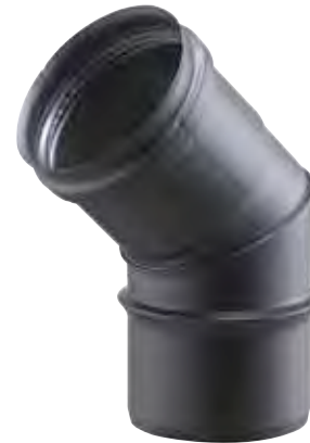
CURVA A 45° 45° BEND