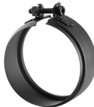
FASCETTA COPRIGIUNTO JOINT CLAMP BAND