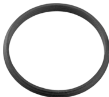
ORING DI TENUTA O-RING SEAL