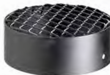
GRIGLIA ASPIRAZIONE NERA AIR INTAKE GUARD, BLACK