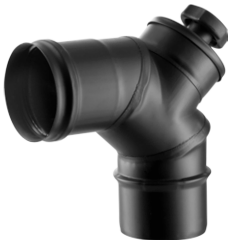
CURVA A 90° CON ISPEZIONE 90° BEND W/ INSPECTION DOOR