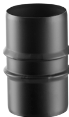
MANICOTTO MASCHIO/MASCHIO MALE/MALE SLEEVE