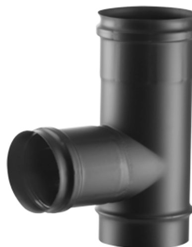
RACCORDO A T 90° STACCO RIDOTTO 80 FEMMINA 90° TEE PIECE, FEMALE BRANCH REDUCED TO 80